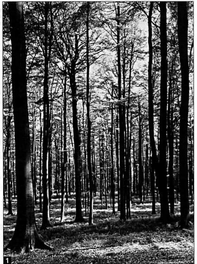
Paysage de forêt.