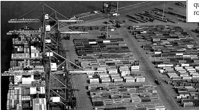
Un portique de transport combiné dans le port du Havre