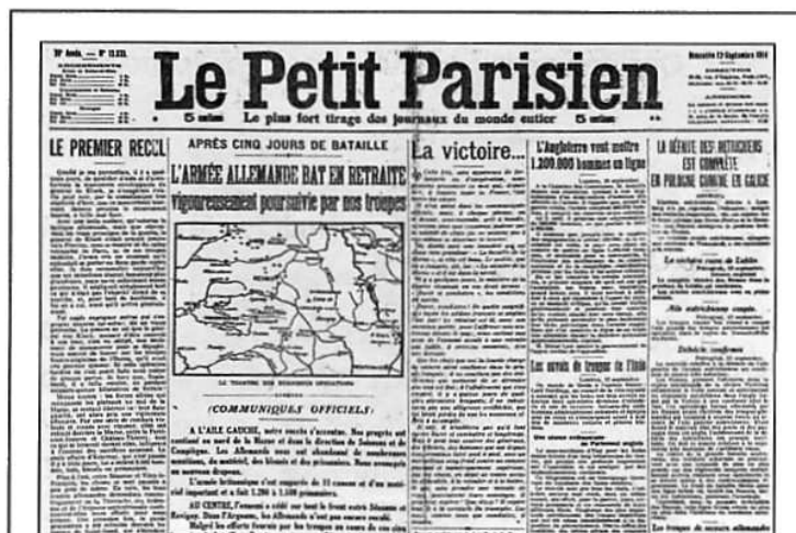
Extrait du journal Le Petit Parisien du dimanche 13 septembre 1914