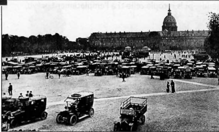
La réquisition des taxis parisiens devant l'hôtel des Invalides, à Paris, le 7 septembre 1914