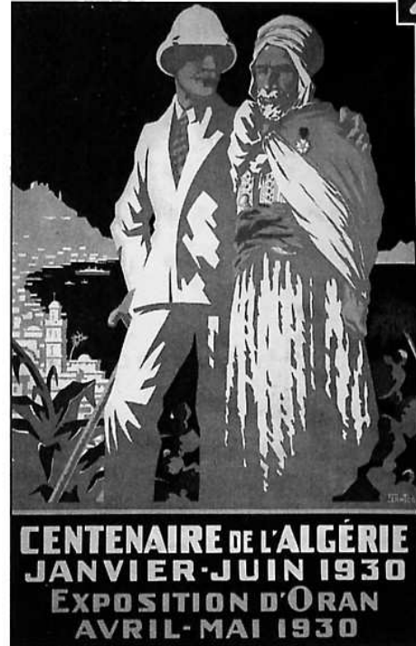
Affiche pour le centenaire de l'Algérie française