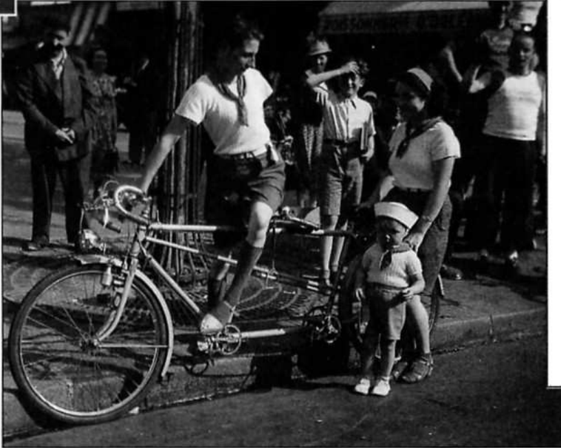
Le tandem, l'un des symboles des premiers congés payés (1937)